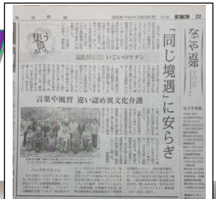
毎日新聞で紹介されました